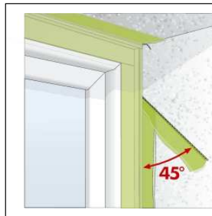
Bild3: Überstehende Folie mit dem Reißfaden unter 45° abreißen.