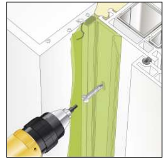
Bild2: Befestigung mit geeigneten Schrauben.